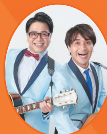
シマッシュレコード