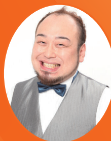
アホマイルド坂本