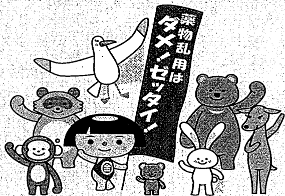
神奈川県PRキャラクターかながわキンタロウ